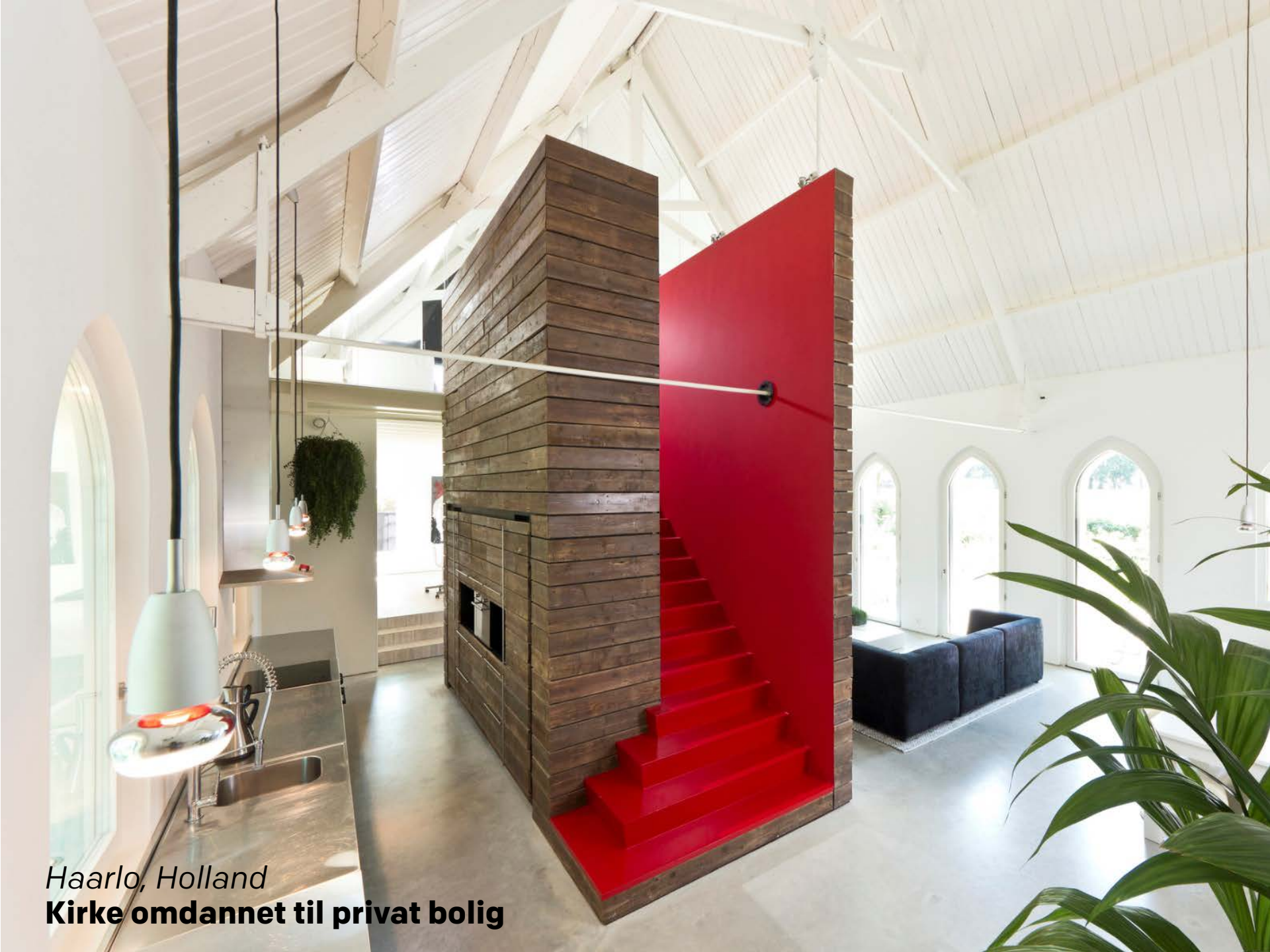
Haarlo, Holland Kirke omdannet til privat bolig