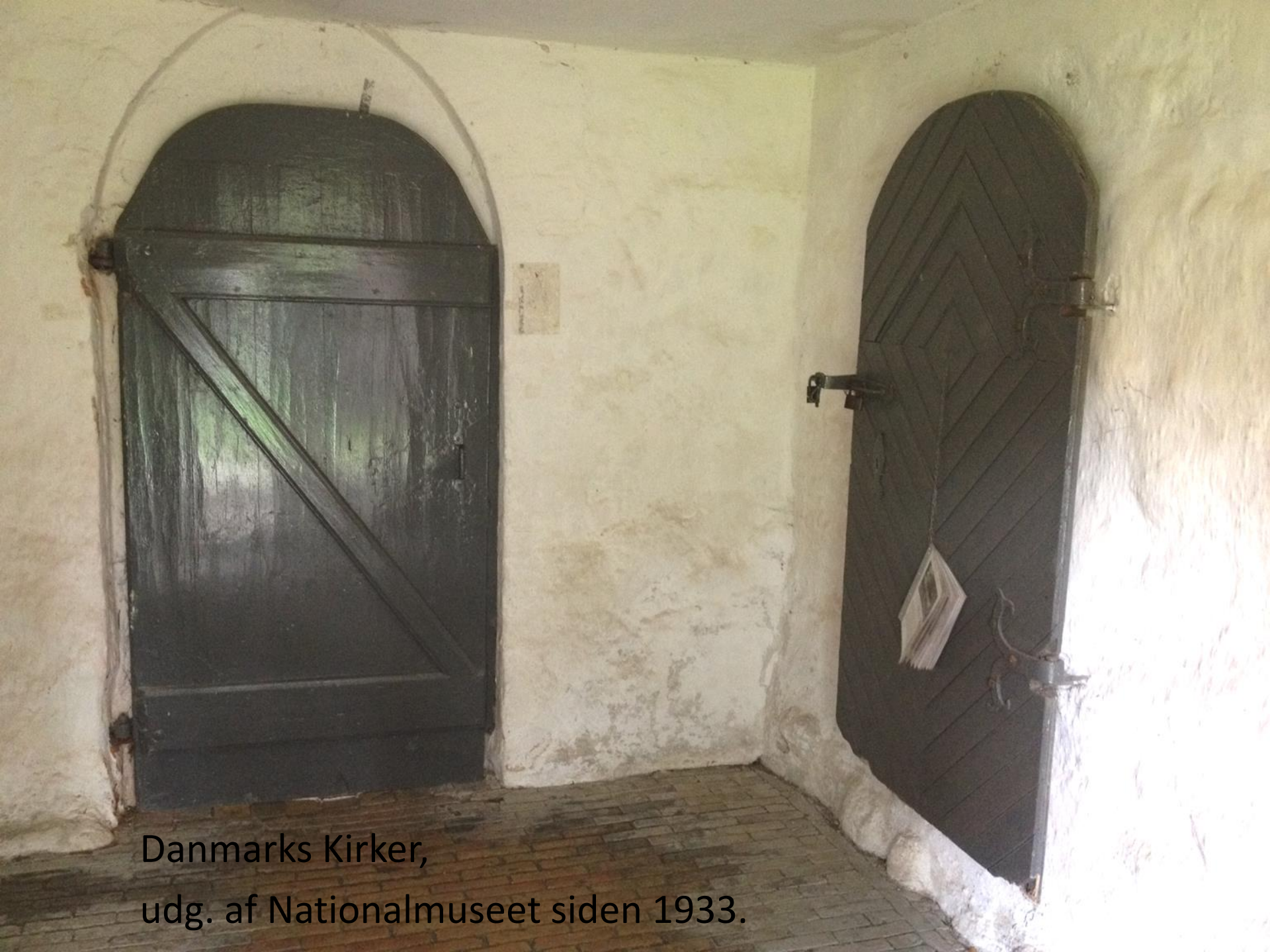
Danmarks Kirker, udg. af Nationalmuseet siden 1933.