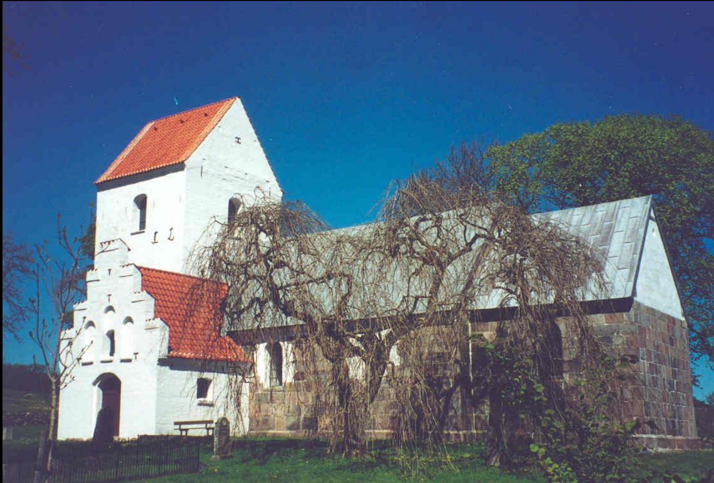
Buderup ødekirke 2003