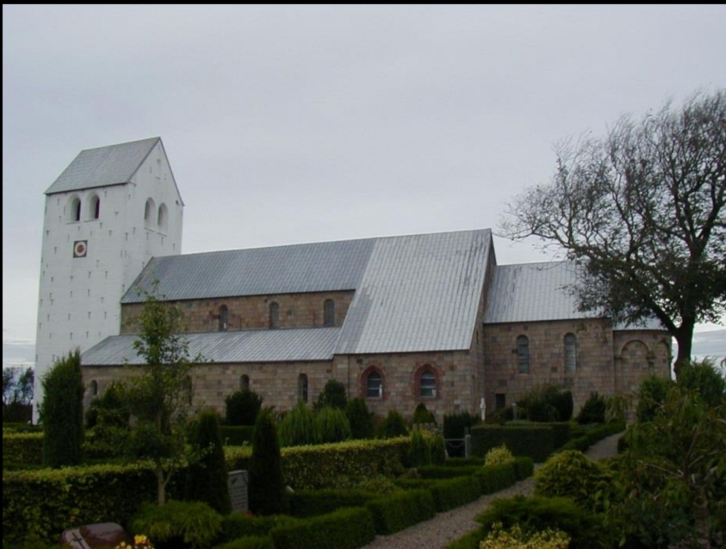
Vestervig er Nordens største landsbykirke