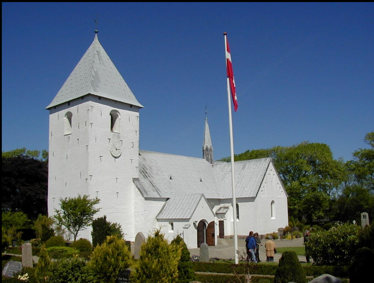
Hurup Kirke, 2.743 medlemmer i sognet