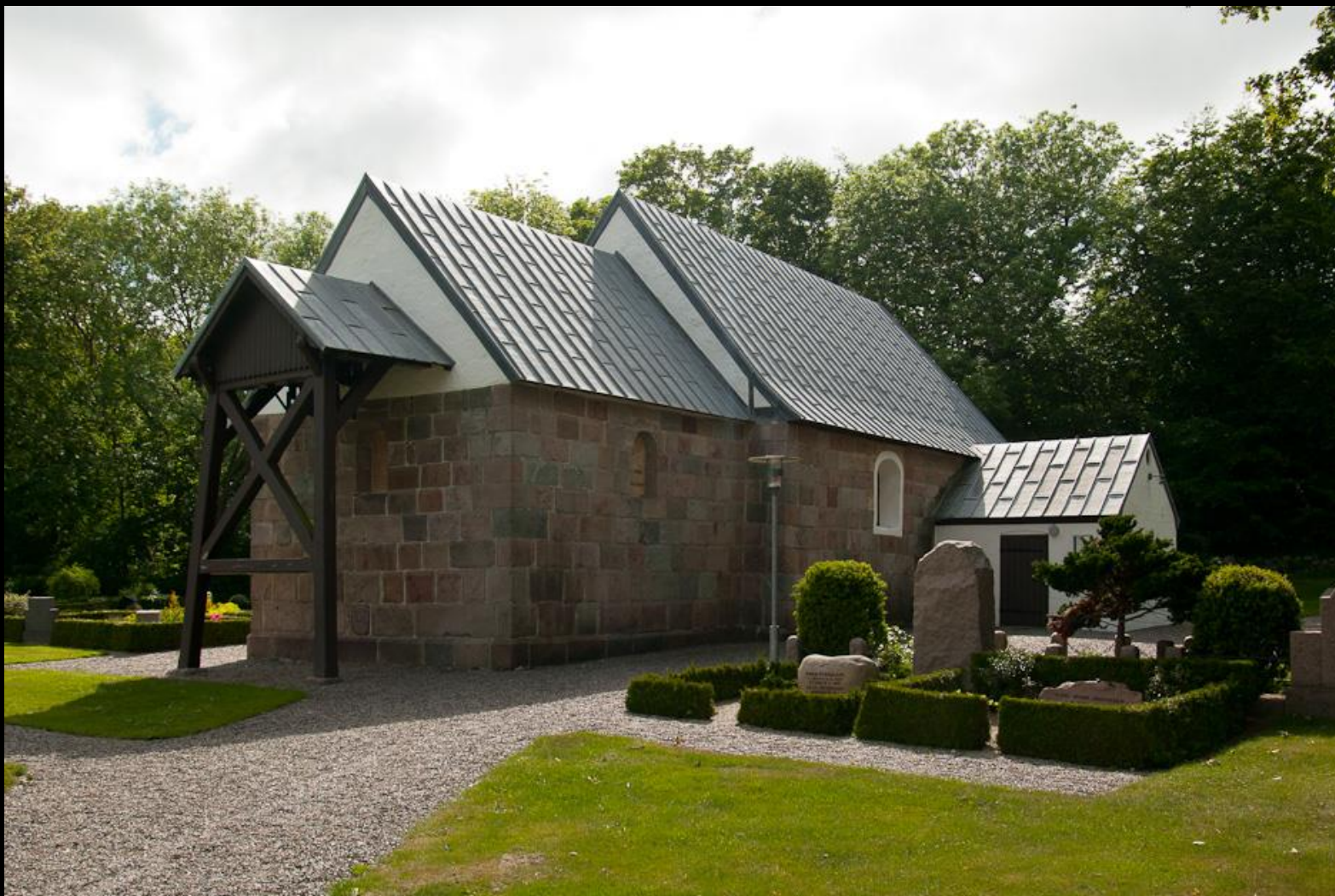
Visby Kirke, 71 medlemmer i sognet