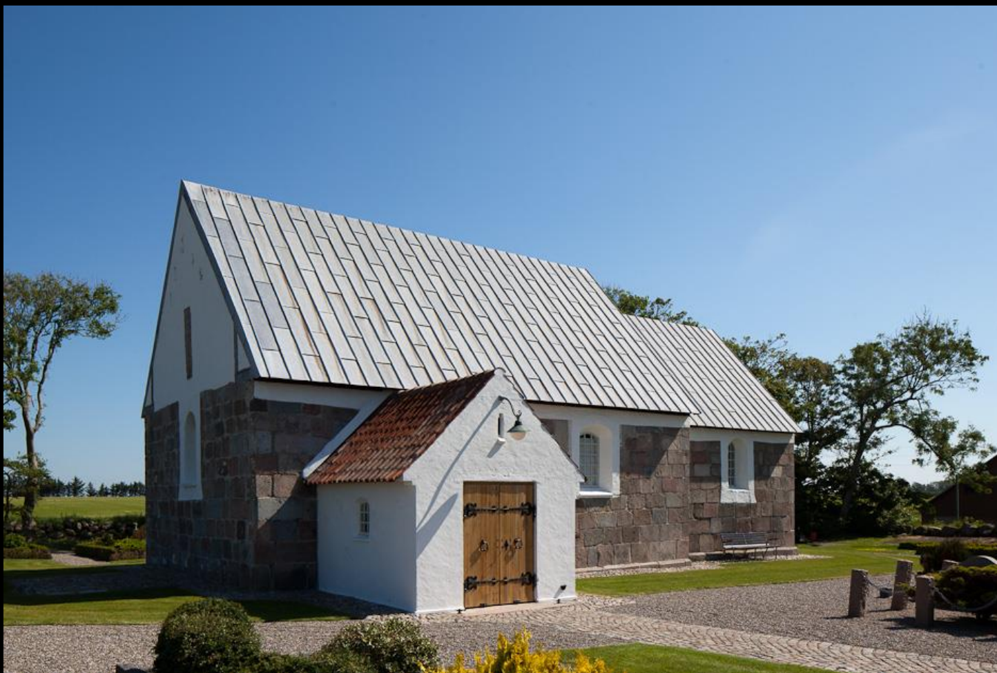
Grurup Kirke, 105 medlemmer i sognet