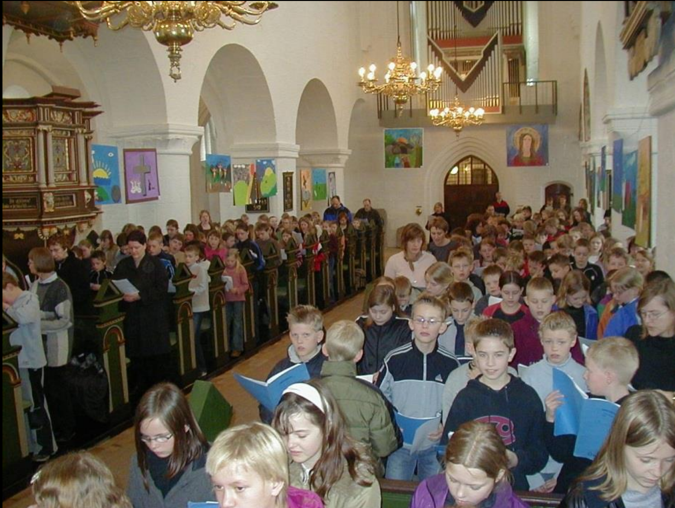
Skole-kirke-tjenesten samler børnene i kirkerne