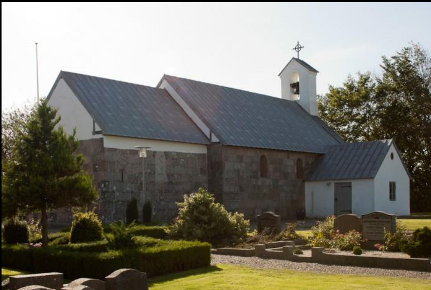
Hassing Kirke, 200 medlemmer i sognet